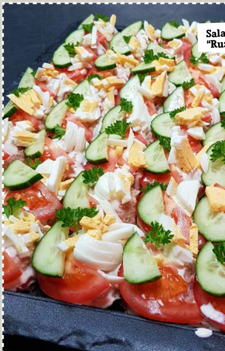
Salade schotel "Russisch Ei"